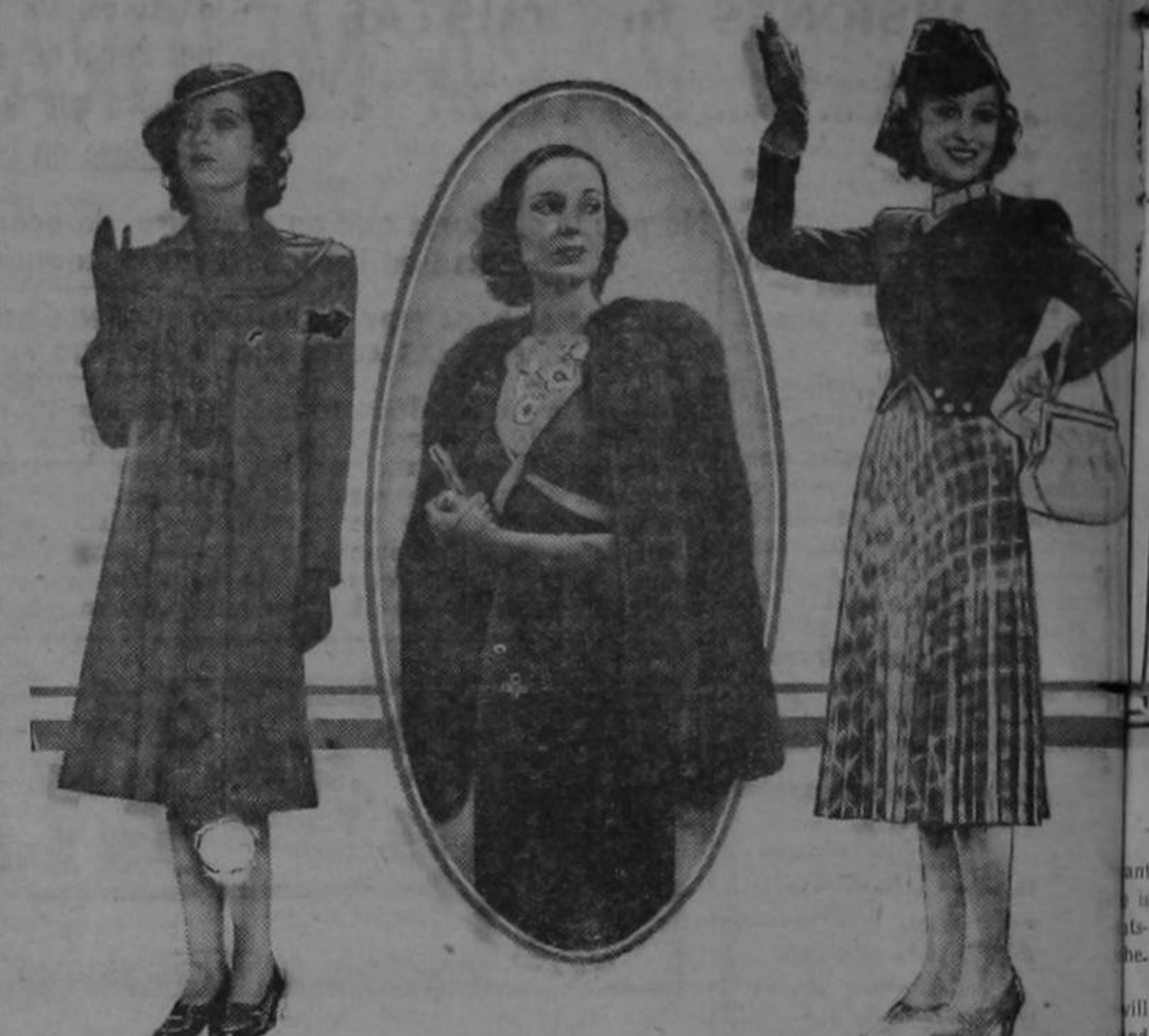
La encantadora Valerie Hobson, que según dicen es la estrella mejor vestida de Inglaterra es la heroína en la producción inglesa de la Columbia, "NUBES SOBRE EUROPA". El atractivo y elegante equipo que Valerie luce en esta foto es prueba irrefutable de la repand. de que goza. En los modelos que aquí ilustramos vemos a Miss Hobson luciendo un conjunto de dos piezas de lana verde adornado con cuero castaño oscuro; un traje de queta de crespón de seda negro adornado con "beige", de mangas ceñidas y con lujosa piel de zorro. Y un gracioso traje de deportes de falda multicolor, en la cual predomina el castaño.